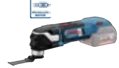
GOP 18V-28 (In L-BOXX 136) cod. 0 601 8B6 001