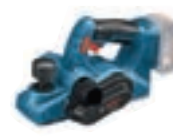
GHO 18 V-LI (In L-BOXX 136) cod. 0 601 5A0 300