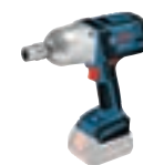
GDS 18V-LI HT (In L-BOXX) cod. 0 601 9B1 302 € 419,00 1)