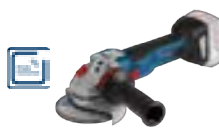
GWS 18V-10 C (In L-BOXX 136) cod. 0 601 9G3 10B