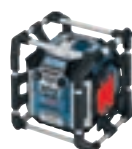
GML 50 cod. 0 601 429 600