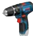
GSB 12V-15 (In L-BOXX 102) cod. 0 601 9B6 90E