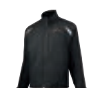
GHJ 12+18V Basic S/M/L/XL/XXL cod. 0 618 800 067/8/9/A/B € 149,00 1)