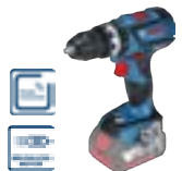
GSB 18 V-60 C (In L-BOXX 136) cod. 0 601 9G2 103