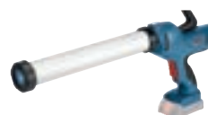
GCG 18V-600 cod. 0 601 9C4 001 € 289,00 1)