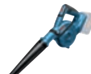
GBL 18V-120 cod. 0 601 9F5 100 € 75,00 1)