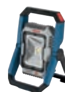
GLI 18V-1900 cod. 0 601 446 400 € 109,00 1)