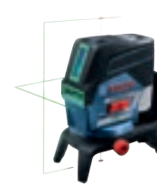
GCL 2-50 CG (In L-BOXX) cod. 0 601 066 H03 € 424,00 1)