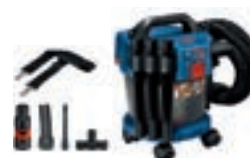
GAS 18V-10 L Set cod. 0 601 9C6 302 € 159,00 1)