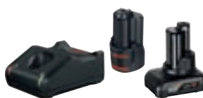
GBA 12V 2.0Ah + GBA 12V 4.0Ah + GAL 12V-40 cod. 1 600 A01 NC9 € 109,00 1)