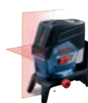
GCL 2-50 C (In L-BOXX) cod. 0 601 066 G08 € 249,00 1)