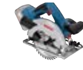
GKS 18 V-57 G (In L-BOXX 238) cod. 0 601 6A2 101