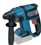
GBH 18 V-EC (In L-BOXX 136) cod. 0 611 904 003