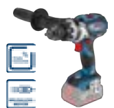
GSB 18 V-110 C (In L-BOXX 136) cod. 0 601 9G0 30A