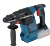
GBH 18 V-26 (In L-BOXX 136) cod. 0 611 909 001