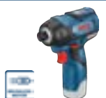
GDR 12V-110 (In L-BOXX 102) cod. 0 601 9E0 003