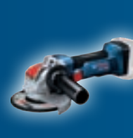
GWX 18V-8 06019J7001