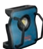
GLI 18V-10000 C Connect cod. 0 601 446 900