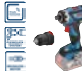
GSR 18 V-60 FC (In L-BOXX 136) cod. 0 601 9G7 102