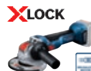
GWX 18V-10 (In L-BOXX) cod. 0 601 7B0 101 € 179,00 1)