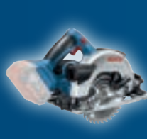
GKS 18V-57 06016A2200