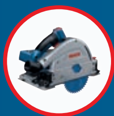
GKT 18V-52 GC