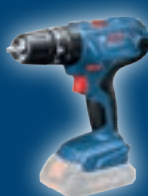
GSB 18V-21 06019H1176