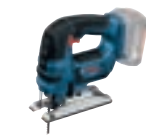
GST 18 V-LI B (In L-BOXX 136) cod. 0 601 5A6 101