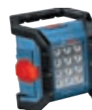
GLI 18V-1200 C cod. 0 601 446 700 € 99,00 1)