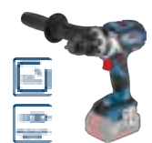
GSR 18 V-110 C (In L-BOXX 136) cod. 0 601 9G0 109