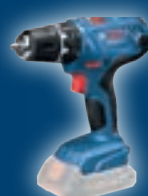
GSR 18V-21 06019H1071

Validità dal 1 ottobre al 31 dicembre 2020