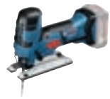
GST 18 V-LI S (In L-BOXX 136) cod. 0 601 5A5 101