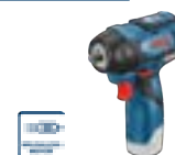
GDS 12V-115 (In L-BOXX 102) cod. 0 601 9E0 10Z