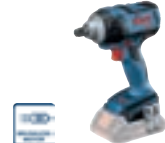
GDS 18 V-300 (In L-BOXX 136) cod. 0 601 9D8 201