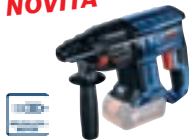
GBH 18V-21 (In L-BOXX 136) cod. 0 611 911 101