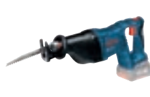
GSA 18 V-LI (In L-BOXX 238) cod. 0 601 64J 007