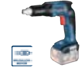
GSR 18 V-EC TE (In L-BOXX 136) cod. 0 601 9C8 004