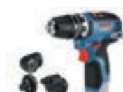
GSR 12V-35 FC Set (In L-BOXX 102) cod. 0 601 9H3 003 € 219,00 1)