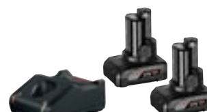
2x GBA 12V 6.0Ah + GAL 12V-40 cod. 1 600 A01 B20 € 159,00 1)