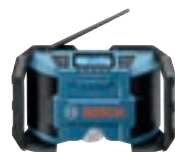
GML SoundBoxx cod. 0 601 429 900 € 119,00 1)