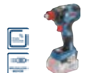
GDX 18V-200 C (In L-BOXX 136) cod. 0 601 9G4 202