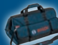
Tool Bag 1600A003BJ