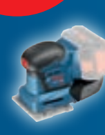
GSS 18V-10 06019D0200