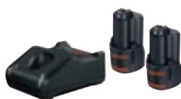
2x GBA 12V 2.0Ah + GAL 12V-40 cod. 1 600 A01 9R8 € 89,00 1)