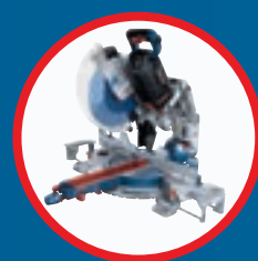
GCM 18V-305 GDC