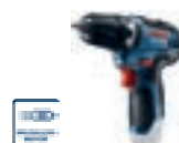
GSR 12V-35 (In L-BOXX 102) cod. 0 601 9H8 001