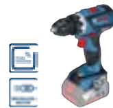
GSR 18 V-60 C (In L-BOXX 136) cod. 0 601 9G1 103