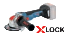
GWX 18 V-10 SC (In L-BOXX 136) cod. 0 601 780 400