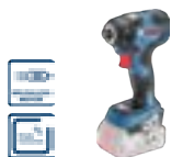
GDR 18 V-200 C (In L-BOXX 136) cod. 0 601 9G4 102