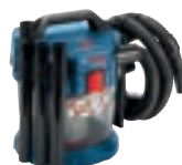
GAS 18V-10 L cod. 0 601 9C6 300 € 135,00 1)