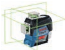
GLL 3-80 CG + BM1 (In L-BOXX) cod. 0 601 063 T03 € 659,00 1)