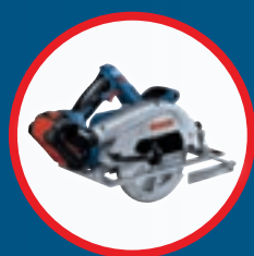
GKS 18V-68 C